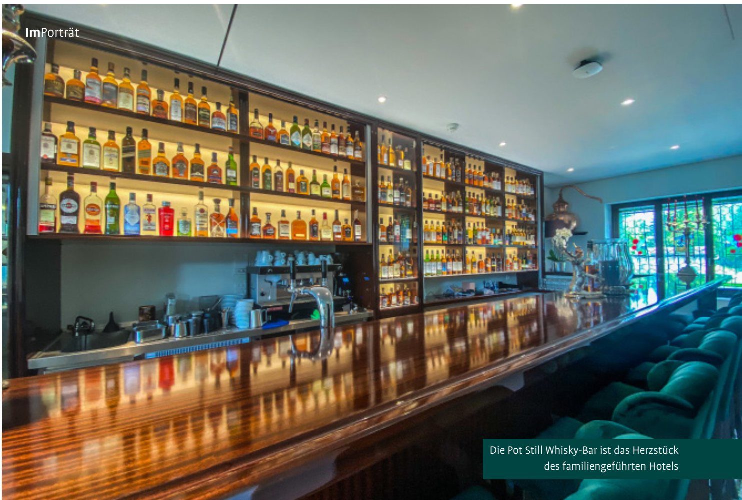
Die Pot Still Whisky-Bar ist das Herzstück des familiengeführten Hotels