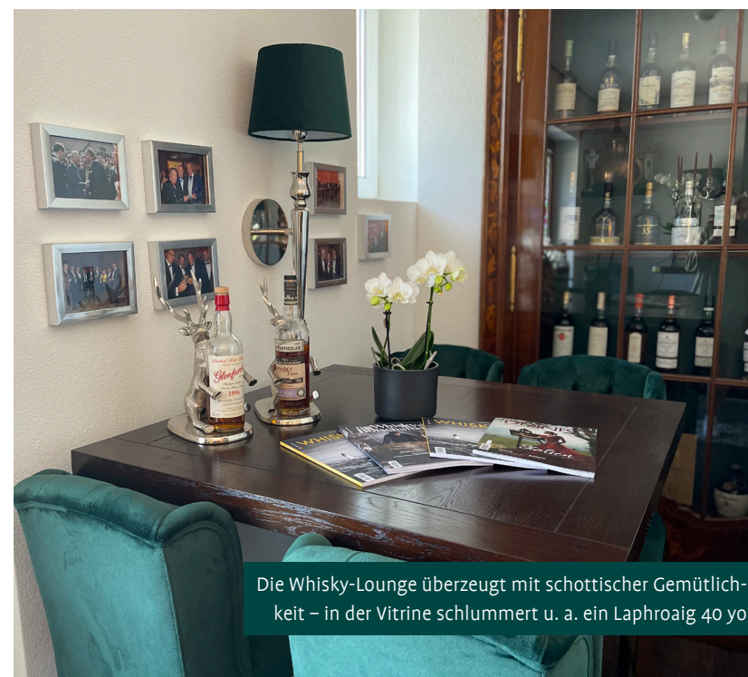
Die Whisky-Lounge überzeugt mit schottischer Gemütlichkeit – in der Vitrine schlummert u. a. ein Laphroaig 40 yo